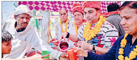
जयंती देवी मंदिर के निकट राहगीरों को मीठा पानी पिलाते संस्था सदस्य।