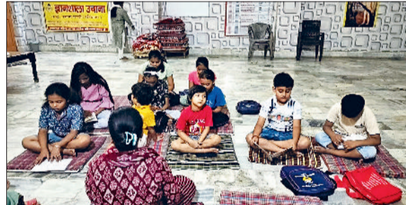
उचना। तेरापंथ भवन में चल रही संस्कार पाठशाला।