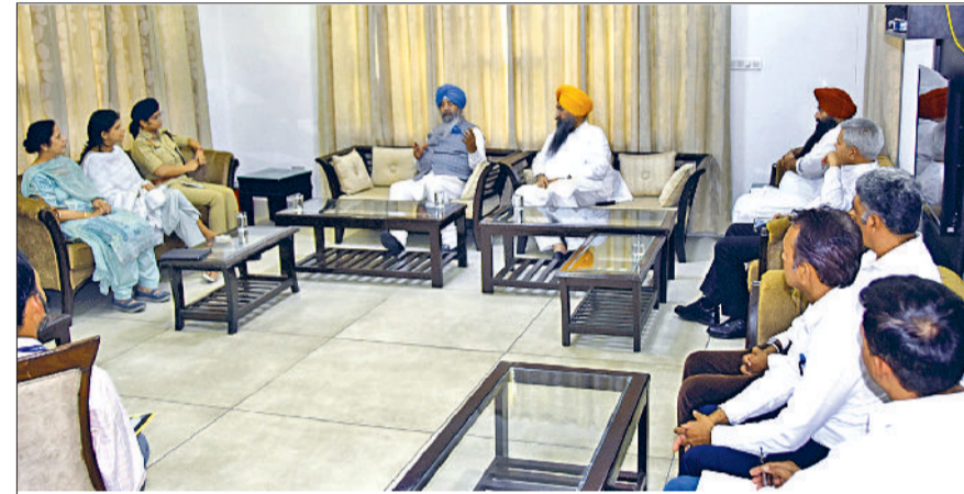
कैथल। राष्ट्रीय अल्पसंख्यक आयोग के अध्यक्ष इकबाल सिंह लालपुरा अधिकारियों से बातचीत करते।

राष्ट्रीय अल्पसंख्यक आयोग के अध्यक्ष इकबाल सिंह लालपुरा ने कहा कि इस प्रकार की घटनाएं समाज में अहसिष्णुता को बढ़ावा देती हैं और इसे किसी भी स्थिति में बर्दाश्त नहीं किया जा सकता। उन्होंने कहा कि राष्ट्रीय