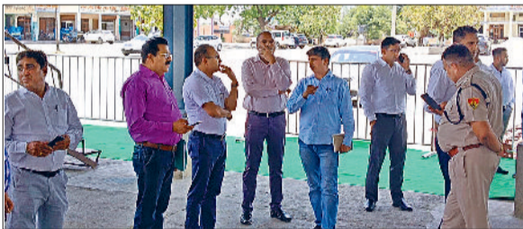
जींद। समारोह स्थल पर तैयारियों का जायजा लेते अधिकारी।

प्रदेशभर के पंजीकृत श्रमिकों के सम्मान में जींद में 19 जून को आयोजित होने वाला जागरूकता एवं सम्मान समारोह किसी सीमित दायरे में न होकर विशाल स्तर का होगा। यह समारोह चौधरी रणबीर सिंह विश्वविद्यालय परिसर की बजाय अब स्थानीय रोहतक रोड स्थित नई अनाज मंडी में आयोजित होगा। जिसमें प्रदेशभर से हजारों की संख्या में पंजीकृत श्रमिक शामिल होंगे। श्रमिकों की जागरूकता के लिए समारोह स्थल पर स्टॉल के माध्यम से प्रदर्शनी भी