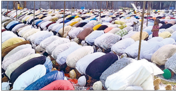
जीट। नमाज अता करते मुस्लिम समाज के लोग।