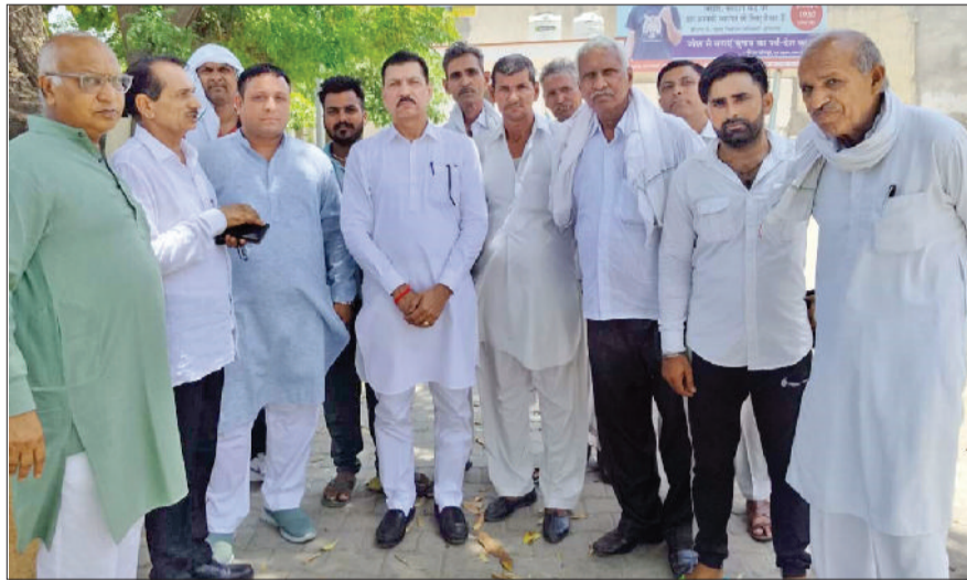
पूंडरी थाने में डीएसपी से मिलने के बाद जानकारी देते हुए समाज के लोग।